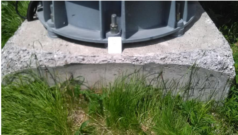
Темељ стуба бр.3 димензија 1,9 x 1,9 m