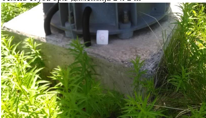
Темељ стуба бр.6 димензија 1,7 x 1,7 m