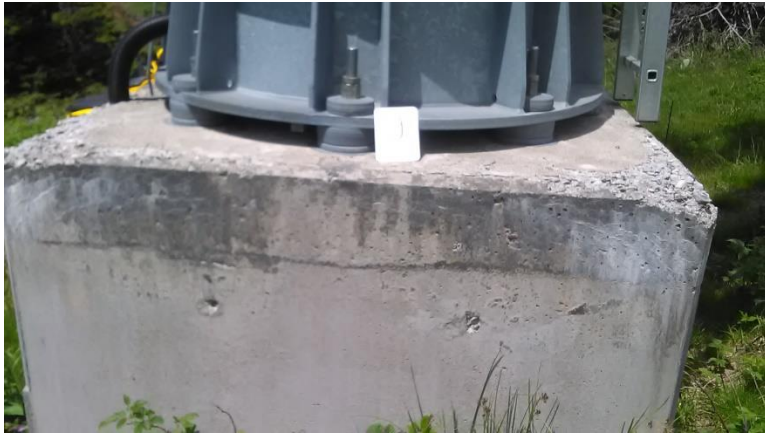
Темељ стуба бр.9 димензија1,65 x 1,65 m