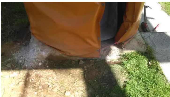
Темељ стуба полазне станице димензија 1,5 x 1,5m,