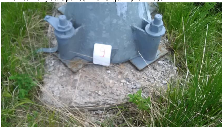
- Темељ стуба бр.9 димензија 1,25 x 0,8m