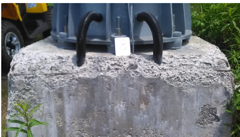
Темељ стуба бр.8 димензија 1,55 x 1,55 m