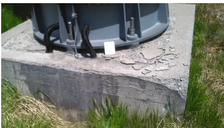
Темељ стуба бр.7 димензија 2,35 x 2,35 m