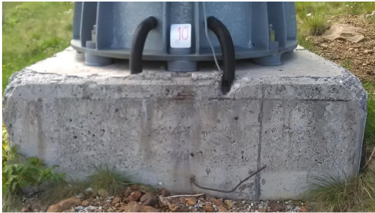
Темељ стуба бр.10 димензија 1,8 x 1,8 m