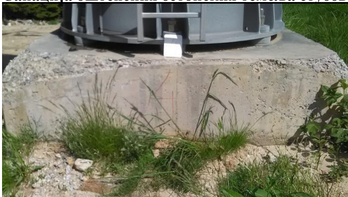
Темељ стуба бр.4 димензија 2 x 2 m