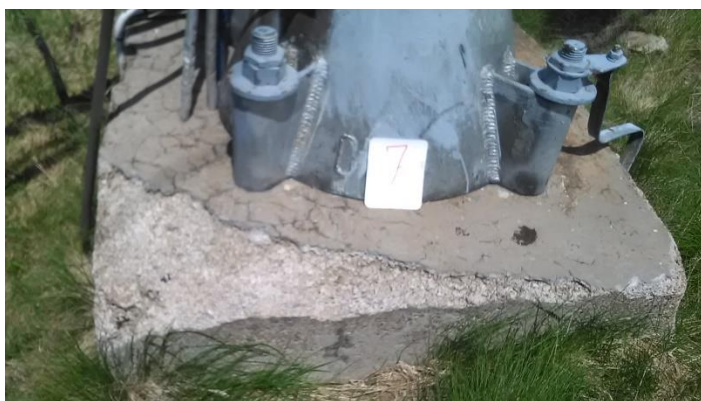
Темељ стуба бр.7 димензија 1,0 x 1,0m