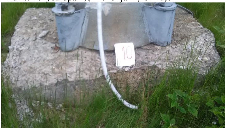
- Темељ стуба бр.10 димензија 1,25 x 0,8m