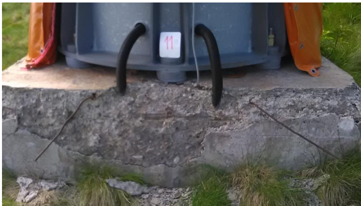
Темељ стуба излазне станице димензија 1,5 x 1,5m