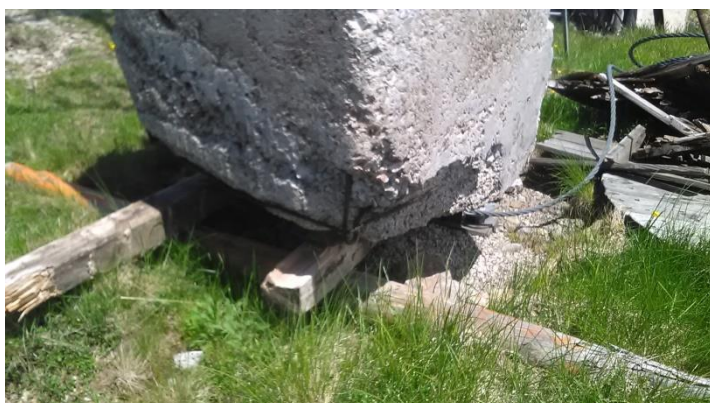
Бетонска плоча испод тега диманзија1,7 x 1,4m и против тег димензија0,8x0,8 x 1,35m