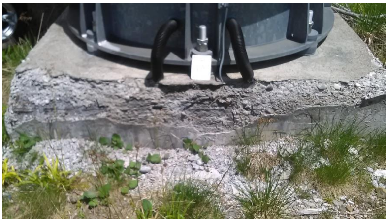
Темељ стуба бр.6 димензија 2,1 x 2,1 m