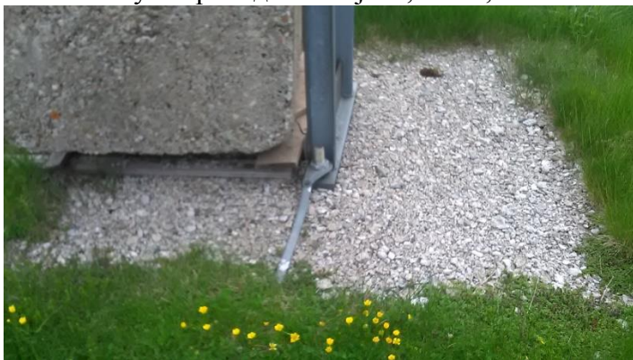
- Бетонска плоча испод тега димензија 1,8 x 2,0m