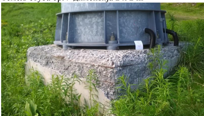
Темељ стуба бр.5 димензија 2 x 2 m