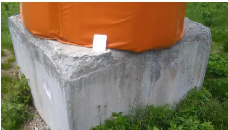
Темељ стуба бр.10 димензија1,75 x 1,75 m.

Уколико је потребно, Понуђач може пре подношења понуде да обиђе терен и сагледа услове рада и неопходне позиције које треба одрадити, у присуству представника ЈП "Скијалишта Србије". Понуђач је у обавези да се најави писменим путем најмање 2 дана раније. Сви трошкови пута, смештаја, исхране и други трошкови падају на терет понуђача.