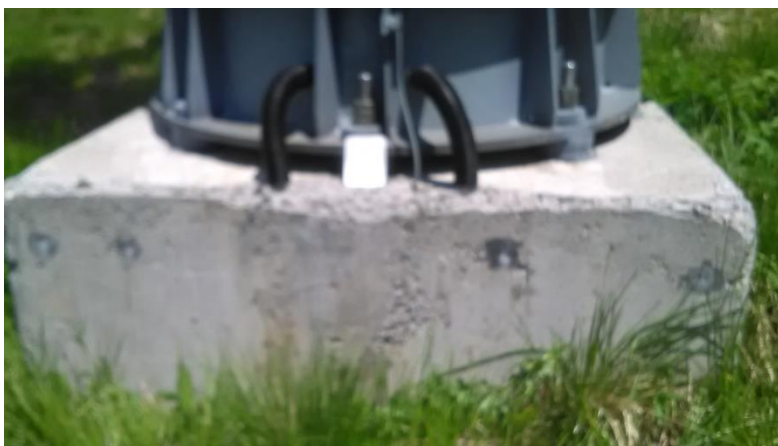
Темељ стуба бр.5 димензија 1,9 x 1,9 m