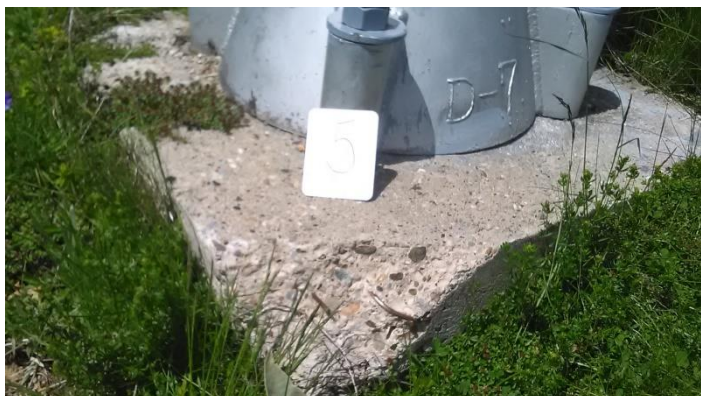
Темељ стуба бр.5 димензија 1,0 x 1,0m