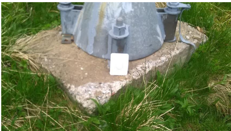
- Темељ стуба бр.4 димензија 1,25 x 0,8m